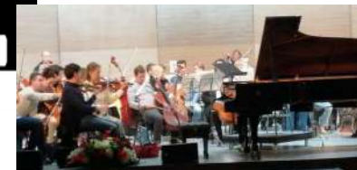
В сентябре в нашей гимназии прошел школьный этап Всероссийской олимпиады школьников по искусству (музыка, русскому языку, ОБЖ, биологии).