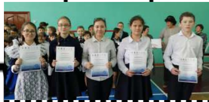
Участники Всероссийского урока по ОБЖ, набравшие максимальное количество баллов.