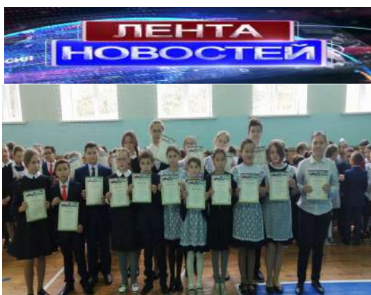
Самые грамотные учащиеся нашей гимназии.